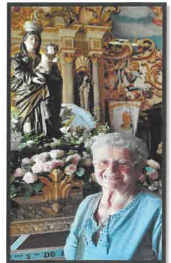
"Nossa Senhora do Amparo"