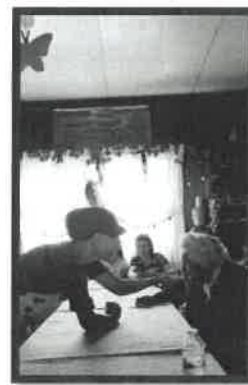
Workshop de Boroa Casa do Povo