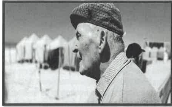
Passeios Balneares e de Interesse Turístico