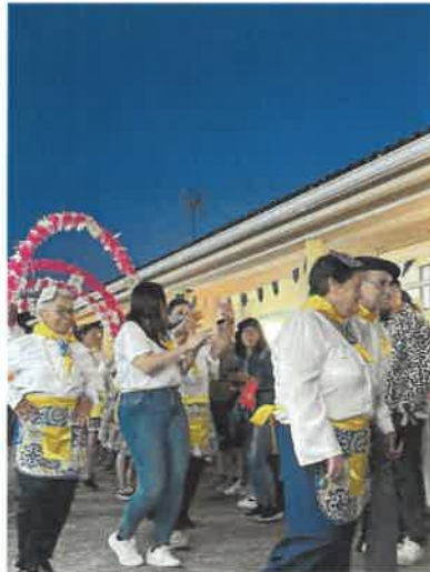
Santos Populares Marchas Interinstitucionais