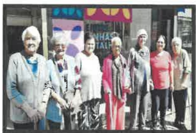
Visita à exposição “Entre Linhas e Retalhos”

Neste contexto, verificou-se também a emergência de novas perceções relativamente ao papel destas profissionais , que evidenciaram um desenvolvimento das suas práticas profissionais. A sua intervenção deixou de se circunscrever exclusivamente às tarefas associadas ao cuidado direto, passando a integrar uma participação mais ativa, autónoma e comprometida na dinamização de atividades ocupacionais, lúdicas e recreativas , contribuindo de forma mais ampla para a promoção do bem-estar e da estimulação dos utentes.