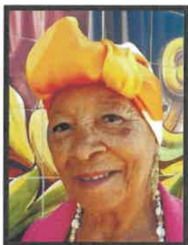
Concurso de Fotografia no âmbito do Mês Atividade” 2.º Lugar