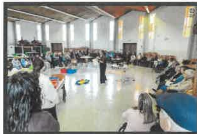
"Jogos da Tarde na Fundação" Atividade interinstitucional