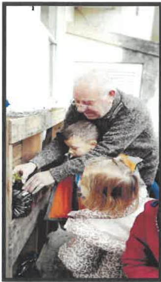
Hortas Verticais "Cultivando Vida"